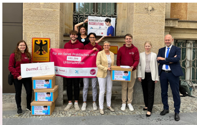
Übergabe der Petition ans BMG

Zuversichtlich zeigten sie sich jedoch beim Mindestabstand zwischen PJ und M3 und die Umsetzung von Lehrstandards voranzutreiben. Der Kampf für bessere Bedingungen im Praktischen Jahr geht damit weiter und wir erwarten den nächsten Entwurf der Approbationsordnung mit Spannung. Weitere Infos zu den nächsten Schritten im Projekt FairesPJ und wie wir in Zukunft für bessere Bedingungen im Praktischen Jahr kämpfen wollen, folgen in den nächsten Wochen.