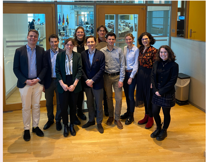
Anhörung zum Praktischen Jahr im Landtag in Sachsen-Anhalt