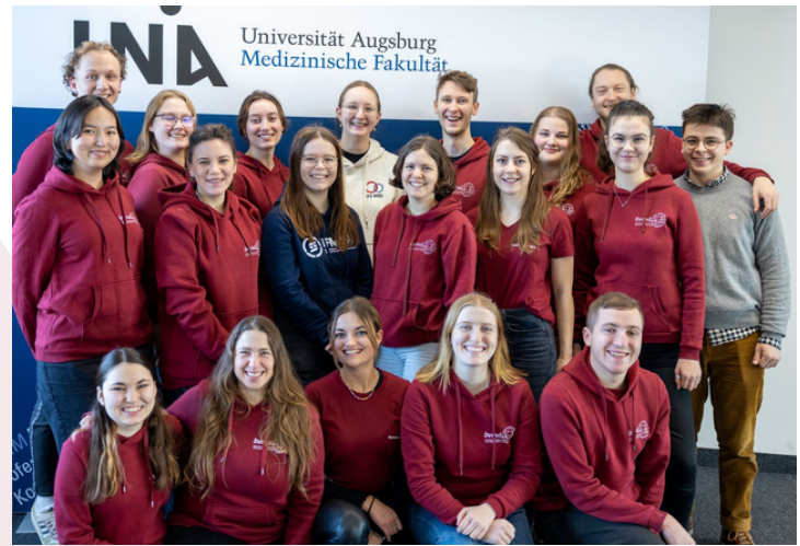
Der neue GeVo und der ErVo in Augsburg

Der Nobelpreisträger Richard Feynman erzählt Anekdoten und Geschichten aus seinem bewegten Leben. Von der Schule, über seine Zeit beim Manhattan Projekt, bis zu seiner ersten Professur und schließlich zum Nobelpreis nimmt er den Leser auf seine sehr charmante und lustige Art mit. Wer noch nie ein Buch über Quantenphysik gelesen hat, wird mit dem Buch genauso viel Spaß haben wie ein ausgesprochener Physik Nerd!