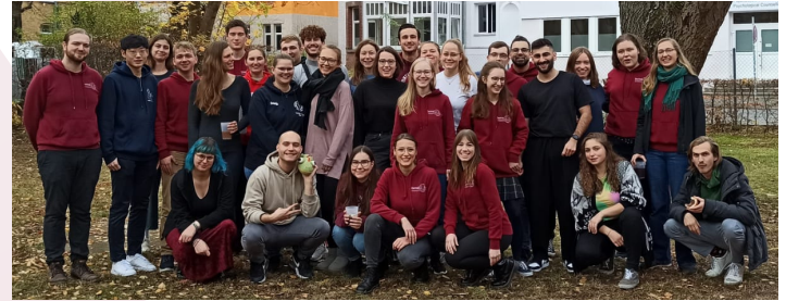
So viele schöne Menschen beim ErVo-Wochenende!